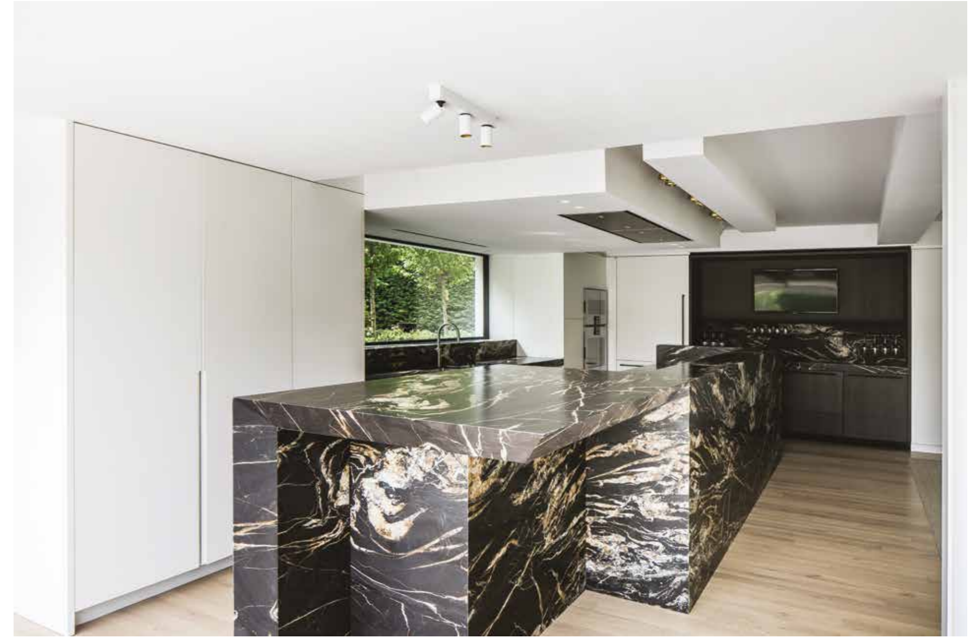
The kitchen island is clad in outspoken black and gold quartzite, making a bold statement. Cabinet doors are purposely kept in a light colour to allow the quartzite to take center stage