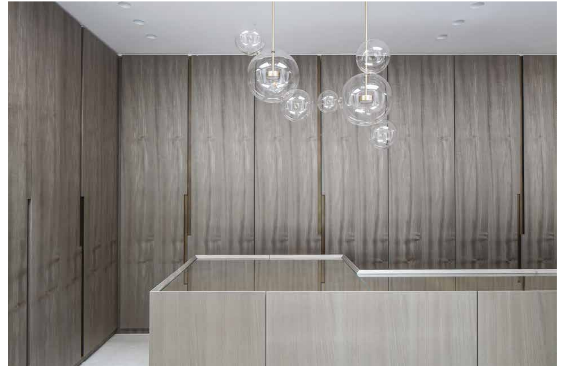
The dressing room doors are clad in smoked poplar creating a soothing backdrop for the Bolle Chandelier by Giopato & Coombes. Left page: the bedroom with rattan chair by Pierre Jeanneret designed for the city of Chandigarh.