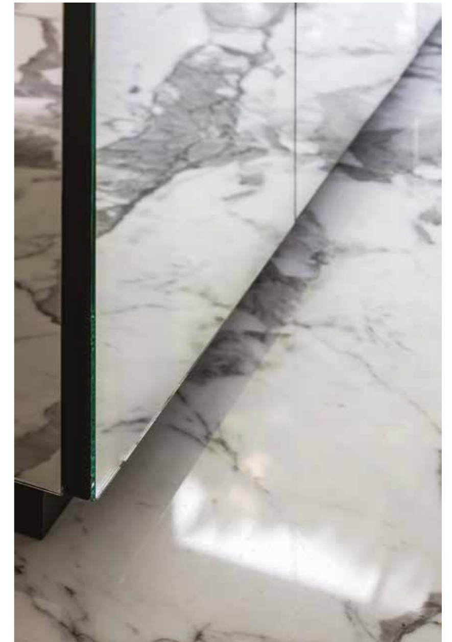
Ravishing Statuario marble with a pure white background and elegant grey veins creates a dramatic look. Sleek bright chrome faucets by Dornbracht add a modern touch to the outspoken bathroom design. The mirrored cabinet doors amplify the dramatic look of the marble.