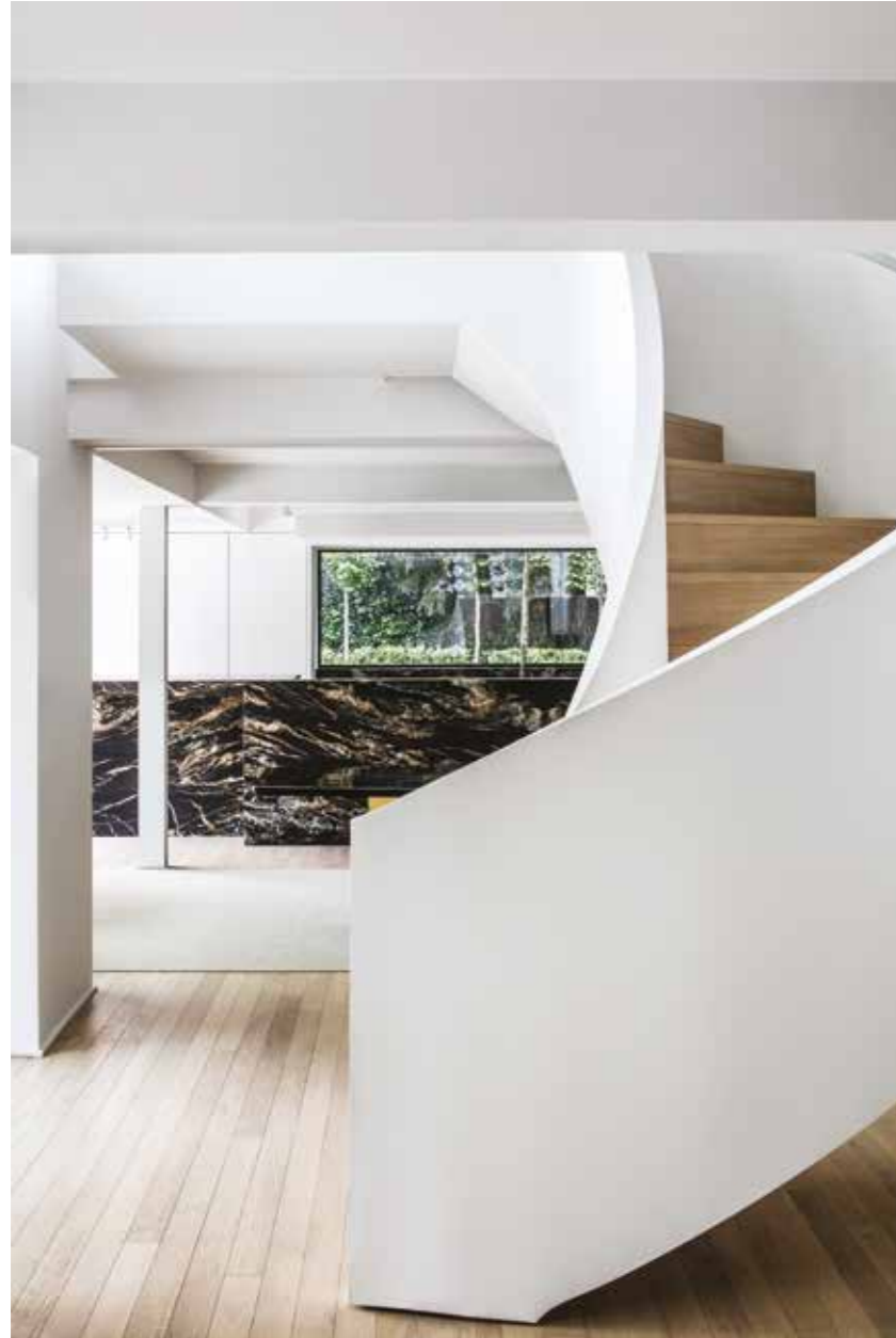
Designed as a simple strong gesture, the sculptural staircase (with the quartz kitchen as a backdrop) is the eyecatcher of this project.